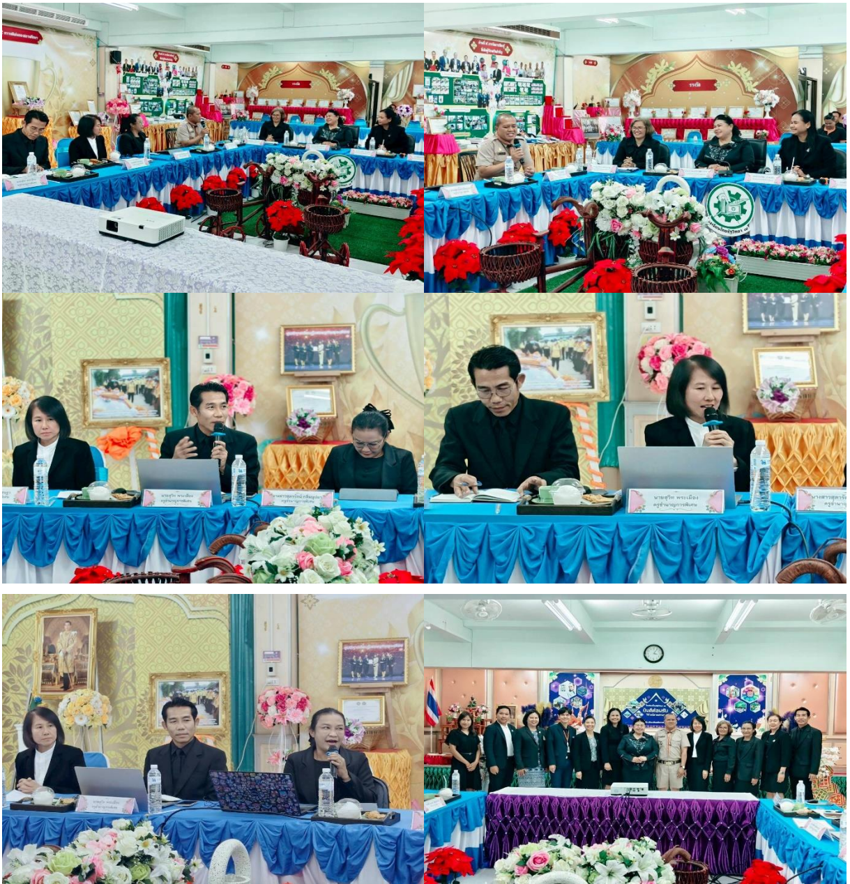
ที่ประชุม รับทราบ