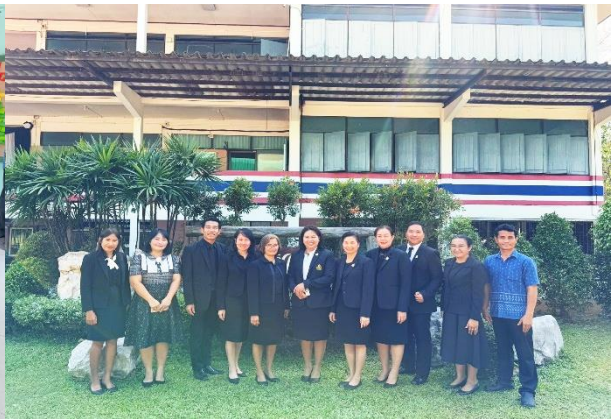
ฝึกปฏิบัติจริงในพื้นที่ (ON THE JOB TRAINING) โรงเรียนองครักษ์ เมื่อวันที่ ๒ มีนาคม ๒๕๖๙