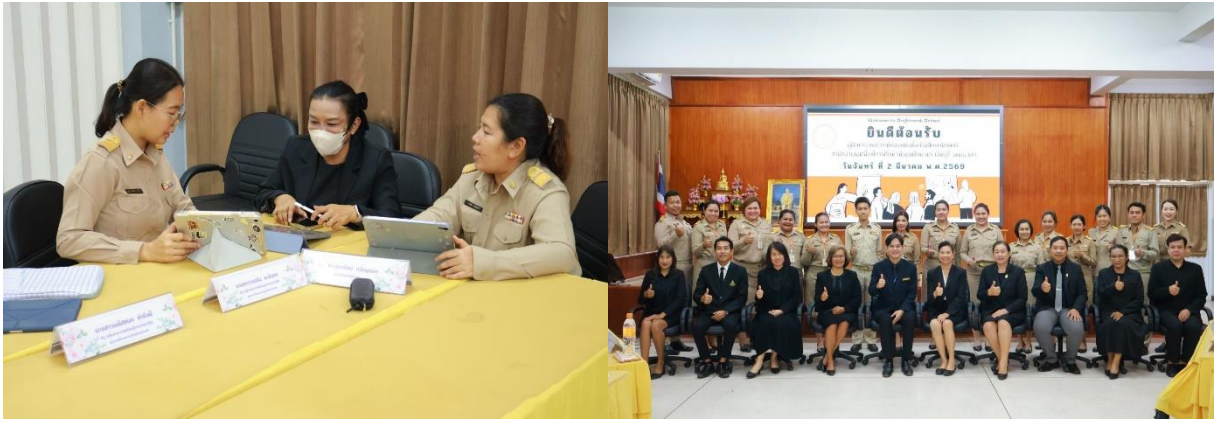
แลกเปลี่ยนเรียนรู้และสะท้อนผลการปฏิบัติงานเพื่อพัฒนาตนเอง และนำข้อเสนอแนะไปปรับปรุงการทำงาน เพื่อเตรียมความพร้อมสู่การปฏิบัติหน้าที่ศึกษานิเทศก์อย่างมีคุณภาพ โรงเรียนไทยรัฐวิทยา ๗ เมื่อวันที่ ๖ มีนาคม ๒๕๖๙